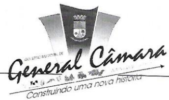
HELTON HOLZ BARRETO Prefeito Municipal

Rua: General David Canabarro, 120 – Fone PABX: (51) 3655-1399 – Fax: (51) 3655-1351 CEP: 95.820-000 GENERAL CÂMARA Rio Grande do Sul CNPJ: 88.117.726/0001-50 email: administracao@generalcamara.com